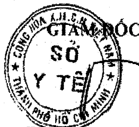
Tăng Chí Thượng